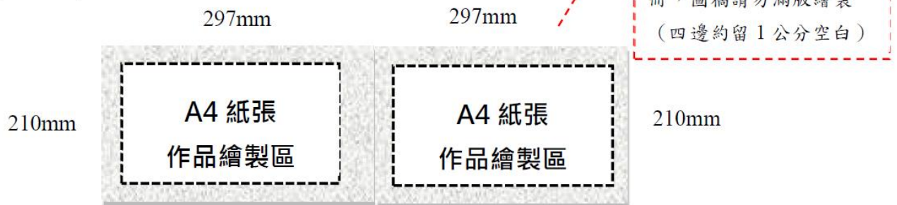
圖 2 作品紙張規格示意圖 (1 組 = 兩頁)